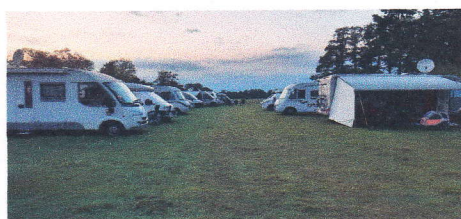
SP Mariechen's Hoff

4 – 8. Tag: Schneverdingen Voßberg 5 SP Mariechen's Hoff Ein einzelner Bauernhof mitten in der Südheide, alles da was man braucht und sehr ruhig. Gute Radwege durch die Heide, und 7 km nach Schniverdingen.