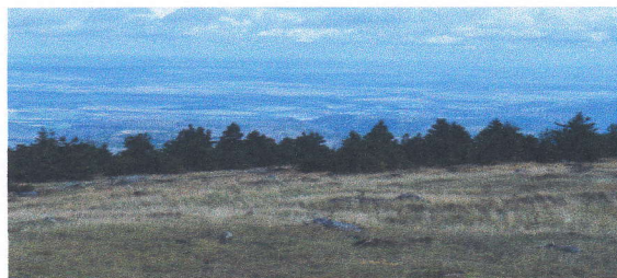
Auf dem Brocken