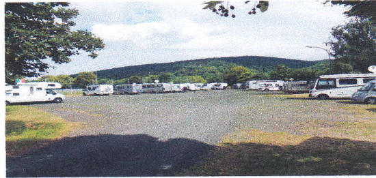
SP Am Wittich

2. - 3.Tag; Weiterfahrt nach Celle SP Celle am Rande der Altstadt.